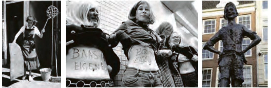
Van links naar rechts: Mattenkloppen, Baas in Eigen Buik en het Lieverdje op het Spui.