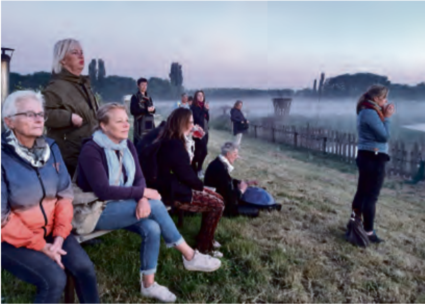
Geduldig wachten.

Bij het dunnen van de appels haal je een deel van het fruit – nog klein en onrijp – eruit om te zorgen dat de boom volgend jaar ook weer appels produceert.