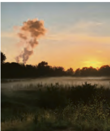
De zon komt op.

Terwijl een muzikant een klankschaal bewerkte, staarden wij gefascineerd naar het punt waar we de zon verwachtten. Een als nar geklede fluitist troonde ons, als de Rattenvanger van Hamelen mee door de boomgaard, waar bij het Leemhuis twee andere muzikanten trommelden.