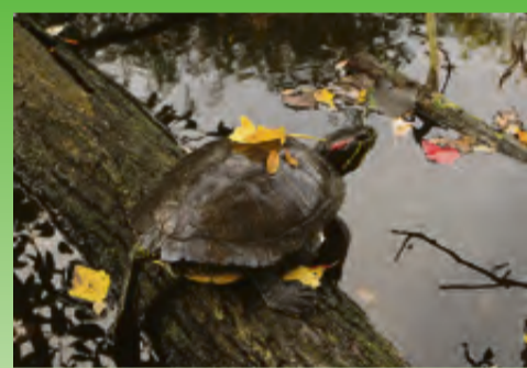
De schildpad in herfsttenuë.

En ja hoor! Onderaan de grote brug die over de President Allendelaan gaat, stond een stapel boomstammetjes. Ze waren in stukken van ongeveer een meter gezaagd. Sommige waren recht, andere krom, met en zonder gekke uitsteeksels. Eén stammetje in het bijzonder trok mijn aandacht en in gedachten zag ik al helemaal voor me hoe de vogels in de tuin er gezellig op zouden zitten of insecten uit zou-