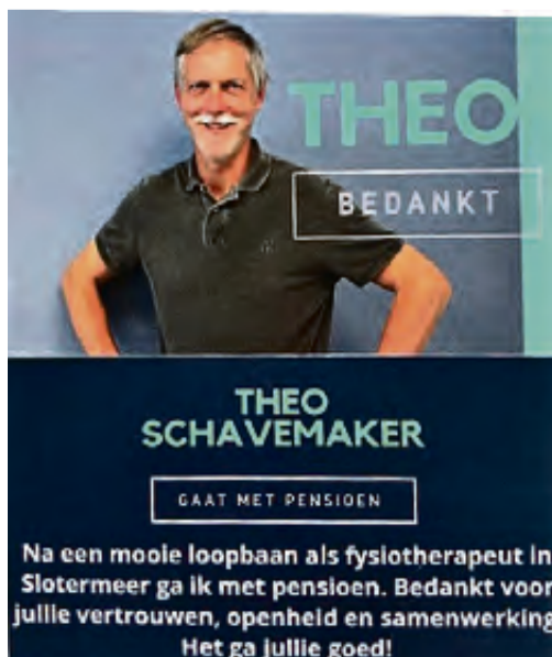
Kaartje bij een klein afscheidskadootje voor de gasten

In zijn wintersportvakantie van 2018 kreeg hij een ongeluk, waardoor hij twee jaar gro-