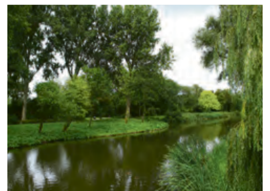
Het Eendrachtspark nu.

Op onderstaande foto is goed te zien hoe groen Geuzenveld nu is. Vanaf het allereerste begin was het in Geuzenveld, maar ook in Slotermeer en Osdorp, een zeer gemengde bevolking. Mensen uit Groningen, Drenthe en Friesland kwamen in de snel groeiende stad het ambtenarencorps van de Gemeente versterken. Bij de Politie, het Gemeentelijk Energiebedrijf en het GVB (tram, bus en pont) vonden velen een plek. Daarna kwamen de mensen uit Indonesië (Indië) die noodgedwongen de Gordel van Smaragd moes-