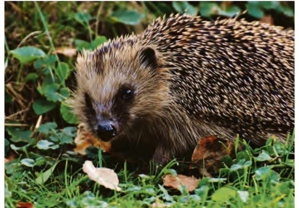
De egel.

Het plaatsen van een egelhuisje kan ook uitkomst bieden. In het voorjaar en in de zomer kunnen vrouwtjes gebruikmaken van het huisje om in te werpen en hun jongen groot te brengen. Afhankelijk van de temperatuur beginnen egels vanaf oktober met de voor-