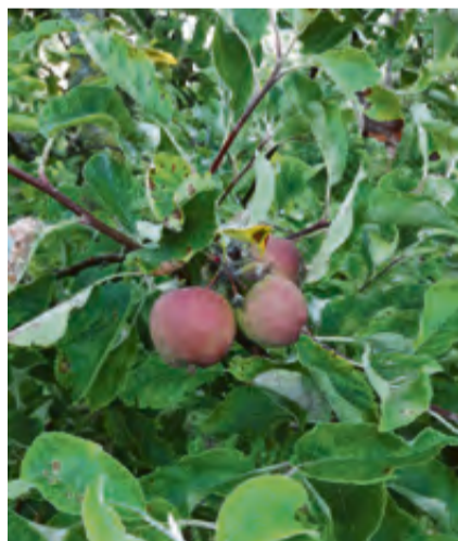
Elstar appels.

de hokken waar de kippen de nacht op stok hadden doorgebracht om ze weer de vrijheid te geven in de boomgaard. Om half acht werden we beloofd met een gezellig en verrukkelijk ontbijt.