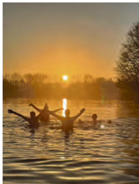
Poedelen in de Plas.