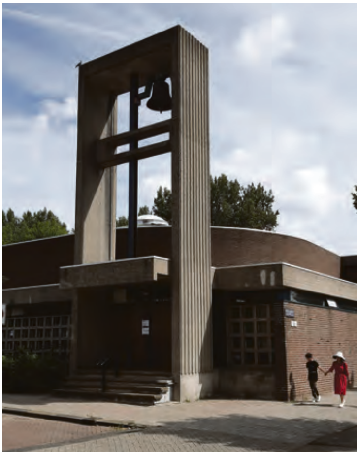
De Pauluskerk.

Bij de kerk zijn veel vrijwilligers betrokken. Zij zijn heel belangrijk! Zonder hen zouden de activiteiten in de kerk niet verder kunnen gaan.