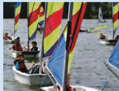
Zeilen op de Sloterplas.

langs de Plas, had ik een déjà vu. Het is weer zomervakantie. Rood, zwart, geel gestreepte zeilen, kleine, eenpersoonsbootjes (optimisten) en grotere boten met witte zeilen. Hele groepen bij elkaar. Oranje hesjes en een drukte van jewelste op de Plas. Op het water is het drukker met groepen dan dertig jaar geleden, maar er is dus nog niet veel veranderd. Er worden nog steeds zeillessen gegeven.