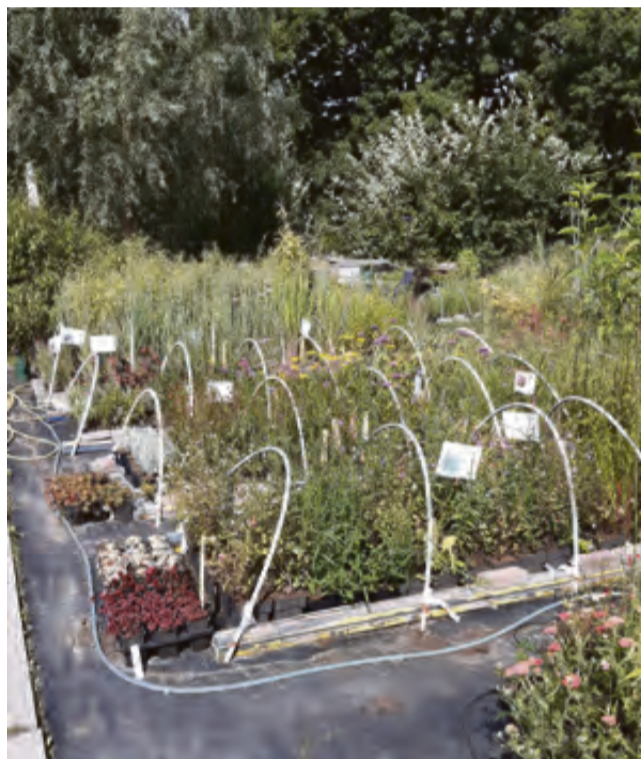
Kwekerij Wiering.

Bij kwekerij WIERING zijn niet alleen plantjes te koop voor in uw tuin. Het bedrijf werkt ook mee aan natuurbevorderende acties. Dit voorjaar waren ze betrokken bij een project in Haarlem. Met andere steden strijdt men daar deze zomer mee om de 'gouden tegel', voor de gemeente die per inwoner de meeste tegels vervuult voor groen. Een andere actie was om boomspiegels in de Frans Halsstraat te voorzien van plantjes.