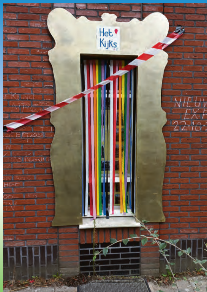
Het "KIJKS" aan de Noordzijde 54.