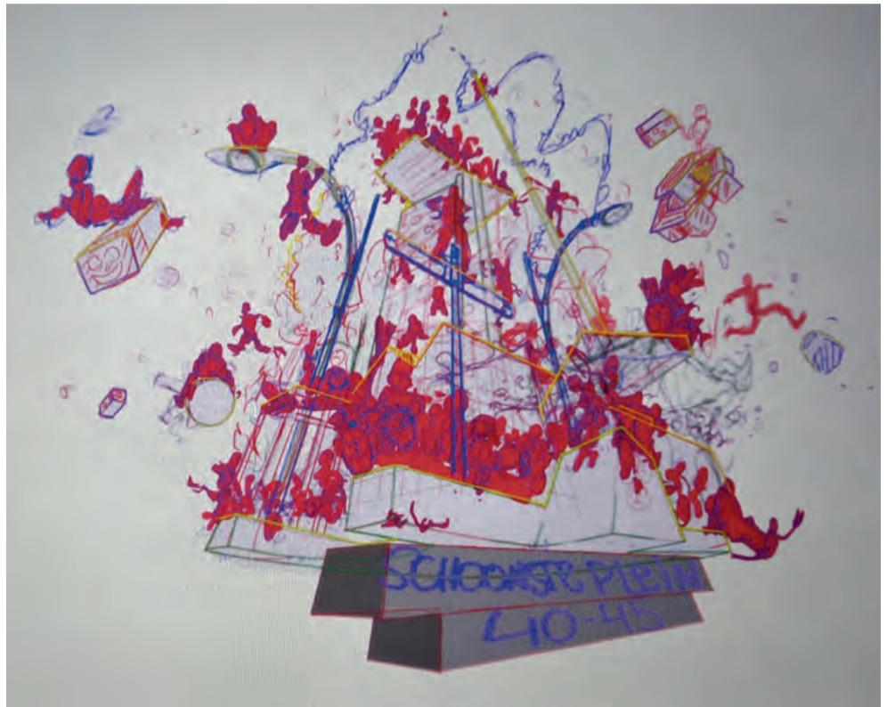
De werktekening van Jorn Huijzendveld