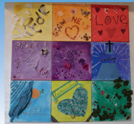
Kunstwerk gemaakt door leden van Oase.

Van de leden van Oase zijn er ook nogal wat mensen die oorspronkelijk uit andere landen komen.