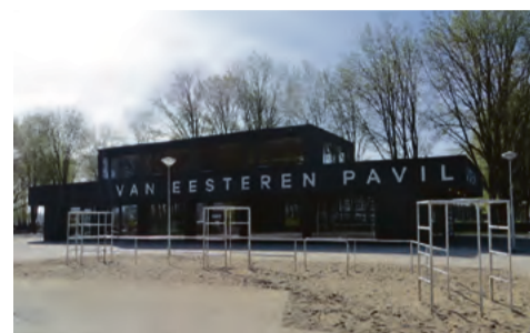
Afdruiprek uit de jaren '50. Kapotte iglo op het 'erf' van de Buurtwerkplaats. Klimrek Aldo van Eyck voor het van Eesteren Paviljoen.

vaardigd, te herkennen aan de lasnaden, die in de originele ontbreken! Tot in de jaren '80 de 'wipkippen' hun intrede deden, nog later gevolgd door de trampolines, waarmee de 'speelse' en tot creativiteit nodende toestellen van Van Eyck helaas tot het verleden lijken te zijn gaan behoren. Er zouden zich nu nog 17 originele intacte speelvelden in de stad bevinden, waaronder aan het Jan Cupidohof en op speelplaats De Witte Klok in Osdorp.