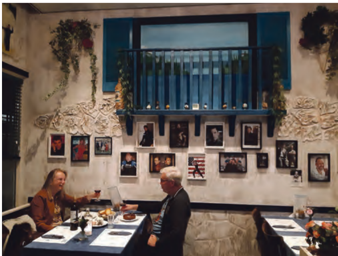
Portrettenwand.