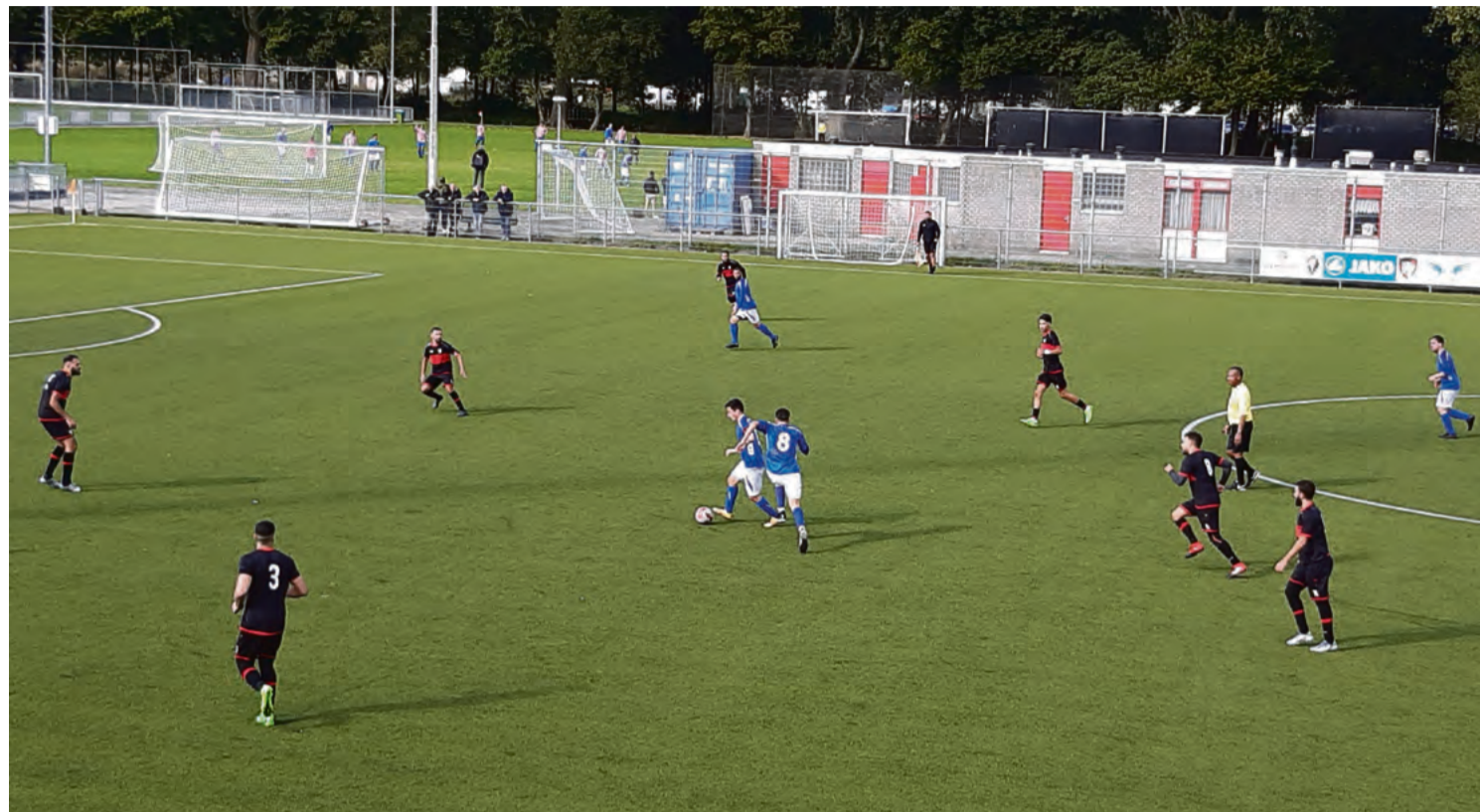
Wedstrijd van Atletico Club Amsterdam.

De buurman, die hier samen met een andere oud-speler een biertje drinkt, vertelt dat het