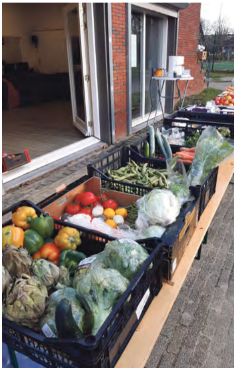
Het groente-aanbod bij speeltuin Dr. Colijnstraat.