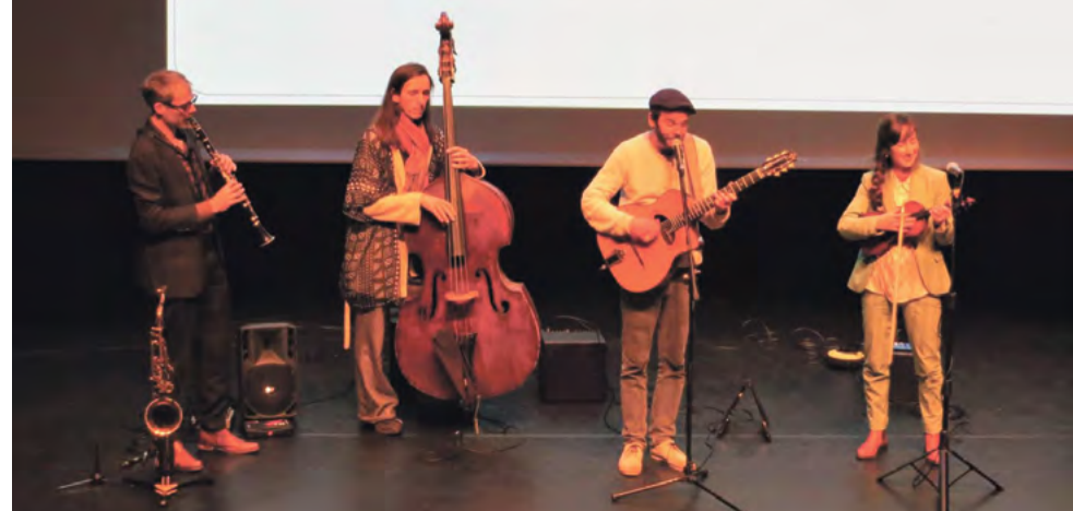
'Pierre et les Optimistes'.

Hugo Hoes CEO Het Kijks Meervaart, november 2022