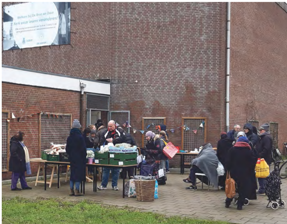
Grote belangstelling in de Dichtersbuurt.

Dinsdag 24 januari ben ik gaan kijken bij de Bron. Er was flink wat belangstelling, ondanks de gure wind. Ook hier hetzelfde beeld; allemaal mensen, vooral vrouwen, met een mobiele boodschappentas en/of grote plastic tassen.