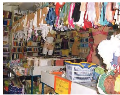
Tussen tierelantijntjes.

Tijdens het gesprek nemen een paar mensen afscheid voor het weekend, met dikke zoenen. Familie? Vrienden? Paula lacht: "Vrij-