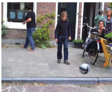
Bijna raak of net niet?

De sneeuw is gesmolten, de Elfstedentocht weer net niet uitgeschreven en de lente is, in ieder geval qua temperatuur, in aantocht. Alle kinderen komen juichend naar buiten om krijgertje te spelen, rondjes te fietsen of te stoepranden.