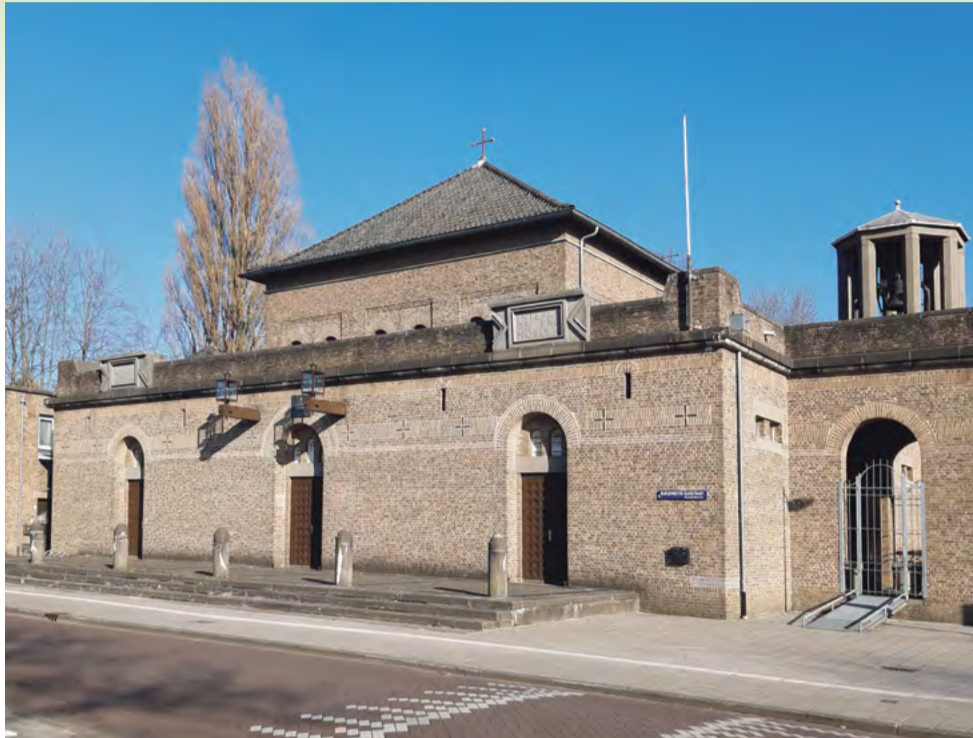
Het kerkgebouw.

De naam van de kerk verwijst naar Mor (= Sint) Sharbil, een heidense priester die zich tijdens de regeerperiode van keizer Trajanus bekeerde tot het christendom. Toen hij weigerde een heidens offer te brengen, werd hij gefolterd en omgebracht. Een keer per jaar wordt Sint Sharbil in deze kerk geëerd. Meer informatie op www.morsharbil.nl