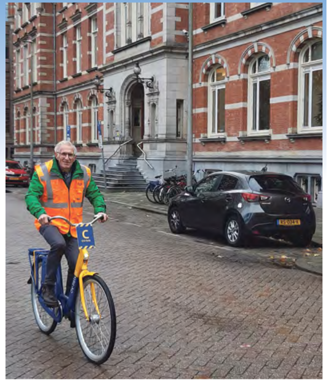
Uw redacteur rijdt een testrondje.

Nu ik toch in Utrecht was heb ik nog een wandelingetje gemaakt naar het Griffpark. Helaas begon het te regenen; gelukkig vanmorgen tijdens de test niet. Toen nog een bezoekje aan het Centraal Museum met mijn nieuwe Museumjaarkaart.