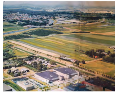
Het land dat bij de boerderij hoorde.

Tot slot van mijn bezoek krijg ik nog een kleine rondleiding, door de boomgaard met perenbomen, sommigen staan er al sinds 1870. Erlangs is een takkenril aangelegd. Verder langs de velden en de kleine kas, waarin de vrijwilligers de stand van zaken bekijken. Er staat nog een soort paksoy.