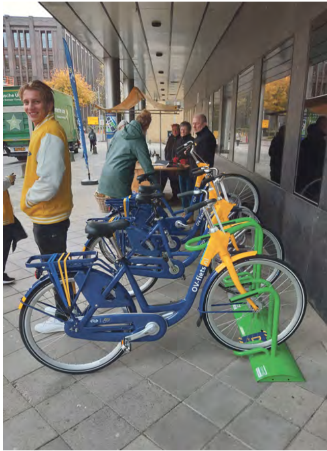
De testfietsen.

Als min of meer regelmatige gebruiker werd ik onlangs uitgenodigd voor een test. Hoewel het prima fietsen zijn, vermoedde ik een verbetering, maar nadere informatie die me achteraf telefonisch werd verstrekt leerde me, dat men de OV-fietsen opnieuw ging aanbesteden en dat enkele fabrikanten een model hadden ingestuurd voor die test.