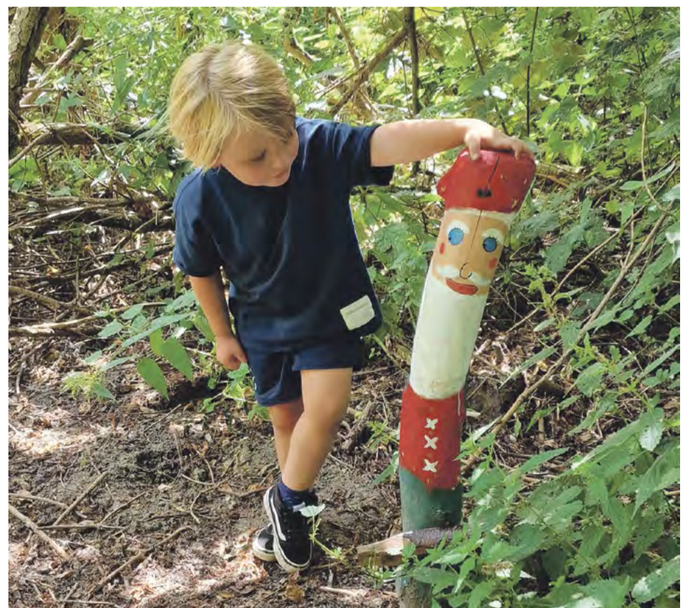
Op het kabouterpad.

In De Natureluur is afgelopen winter overigens hard gewerkt, waardoor dit voorjaar meteen al dankbaar gebruik gemaakt kan worden van een nieuw speelterrein. Al met al genoeg reden voor (groot)ouders en kinderen om erop uit te gaan en gezellig een van de nieuwe evenwichtsbalken op te zoeken. Wie er het eerst vanaf valt, moet afwassen!