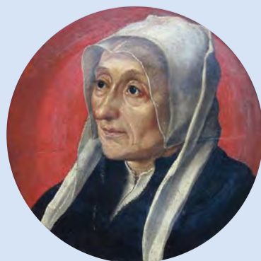
Onder: Kenau Simonsdochter Hasselaer Boven: Wigbold Ripperda.

Wigbold Ripperda was een zoon uit het oudadellijke geslacht van Rijksbaron Ripperda uit het Groningse Winsum. Hij vocht aan de zijde van Willem van Oranje en werd door hem benoemd tot commandant over de troepen die tijdens het beleg van Haarlem de stad verdedigden tegen de Spanjaarden. Hij was dus ook de leidinggevende van Kenau tijdens dit beleg. Kenau heeft het er levend van afgebracht, in tegenstelling tot Wigbold, die met wel 100 van zijn strijders is onthoofd op de Grote Markt van Haarlem, nadat de Spanjaarden uiteindelijk de stad hadden ingenomen, ondanks hun belofte de levens van de Haarlemmers te sparen.