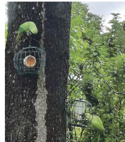
Ha, pindakaas.

Al gauw echter bleek dat grotere vogels (Eksters, Kauwen, Halsbandparkieten) in een mum van tijd zo'n pindakaaspotje leeg aten. Wegjagen om de mezen voorrang te geven helpt meestal maar even.