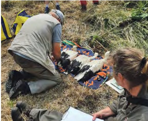
Als echte Amsterdammers kijken de ooievaars niet uit met oversteken. Foto: Marjori Hong, Gefladder.nl Hoog bezoek bij de ooievaars. Foto: Hans Staphorsius. Ooievaars ringen in Park de Kuil (een vierde ooievaar ligt verscholen achter de ringer). Foto: Hans Staphorsius