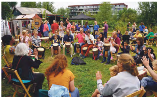
Djembeworkshop tijdens het Sloterplas Art Festival

Op zaterdag 16 september en zondag 17 september is het twee dagen feest aan de Sloterplas in Amsterdam Nieuw-West, waar te genieten valt van bijzondere optredens, heerlijk eten, sportactiviteiten en een gezellige sfeer. Twee festivals die elkaar perfect aanvullen. 16 september vindt het Sloterplas Art Festival plaats bij de Buurtwerkplaats Noorderhof naast het Sloterparkbad. Een intiem festival met veel aandacht voor lokale culturele initiatieven en de uitreiking van de jaarlijkse New WeSter cultuurprijs. Deze prijs wordt uitgereikt door