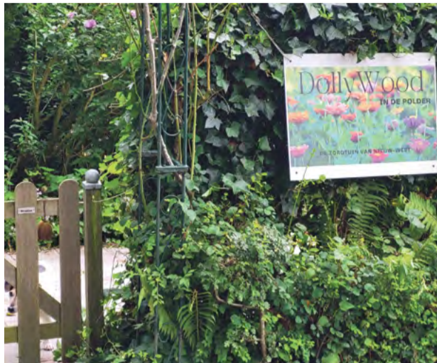
Zorgtuin Dollywood.

Minne begeleidt enkele ex-junkies en probeert een van hen zo ver te krijgen, dat ook hij te zijner tijd de bus zou kunnen rijden.