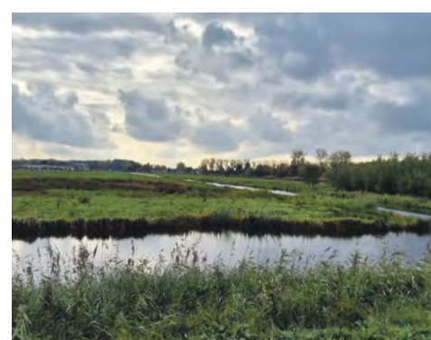
Prachtig uitzicht over 'Het platteland van Amsterdam' (Ma Braunpad).

En zo komt een toevallige ontmoeting tot leven. Geen leuke aanleiding, wel een leuk gesprek. De dame die voor me stond, blijkt met een collega een boek geschreven te hebben met ontwerprichtlijnen voor een fijne openbare ruimte voor mensen in de stad: Prettige Plekken (Prettigeplekken.nl). Zij vertelde: "Als je met de visie van Prettige Plekken naar de Tuinen van West kijkt, dan zie je ook meteen wat er nog beter kan, want een prettige plek voldoet aan de vier V's: Variatie (om naar te kijken), Verblijf (fijn zitten met een aantrekkelijk uitzicht), Verplaatsing (comfortabel 'van A naar B') en Veiligheid (mensen in de omgeving)." De lastig te nemen drempels vallen volgens hun visie dus onder de 'V' van Verplaatsing. "Trouwens, is het u ook opgevallen, dat de