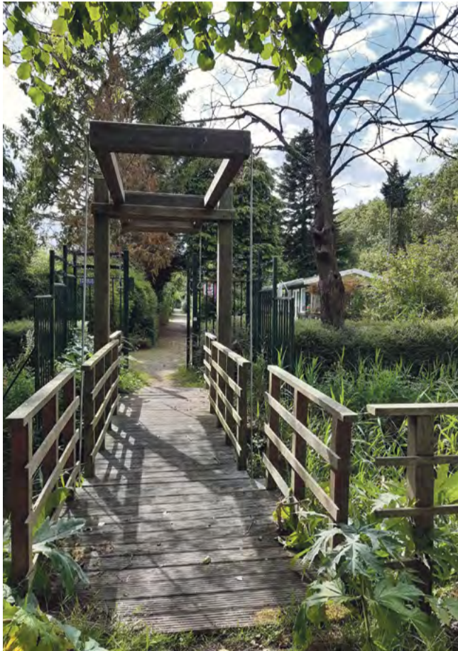
Bruggetje in de wandelroute.

Op vrijdag 30 juni ben ik volkstuintuinpark Osdorp gaan ontdekken, dat al sinds 1968 in de – toen nog – Osdorper Binnenpolder werd opgericht. Het ophaalbruggetje dat werd aangelegd in het kader van de wandelroute over de vier volkstuintuinen, was zowaar open. Om insluipers te weren houdt het bestuur de brug nogal eens dicht. Zaterdag 1 juli had men inderdaad de brug opgehaald.