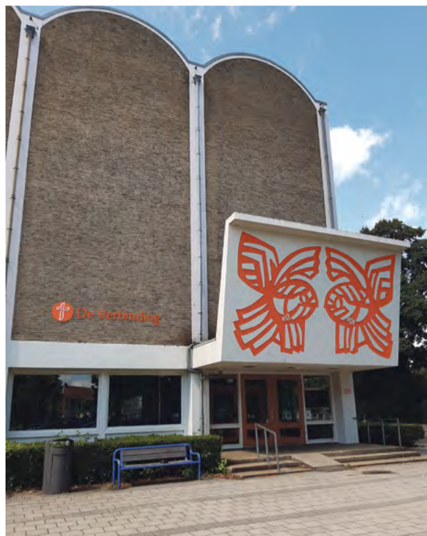
Exterieur van de kerk.

In het gebouw waar vroeger een hervormde kerk was, de Hoeksteen en later de protestantse kerk, de Ontmoeting, aan de Louis Couperusstraat 133, is nu een Baptistenkerk gevestigd. Zondag 16 juli heb ik de kerk bezocht. Op een bankje voor de kerk zat een drietal leden van de kerk; hun taak was deze zondag: 'brandwacht'. Eén van hen bracht me door het gebouw, langs de samenkomst van een kring tieners, naar de achteringang van de kerkzaal, een theaterachtige setting met een flink aantal bezoekers.