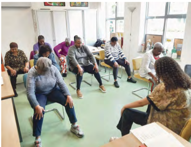
Yoga in de crearuimte van de Brug.

Elke vrijdagmiddag komen de dames van de Creatieve groep bij elkaar in de Brug. Er worden veel mooie dingen gemaakt, maar af en toe komt een kleindochter een van de Creadames langs om een yogales te geven. Lekker ontspannend op de eigen stoel, in de crearuimte waar de tafels even opzij worden gezet. Daarna wordt er heerlijk aan yoga gedaan, waarna het creatieve proces weer wordt voortgezet.