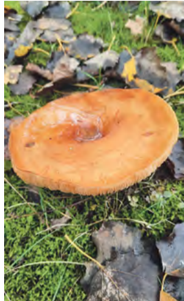
Vaaggeordelde melkzwam.

Narita is niet alleen een Japanse luchthaven, maar ook de naam van een weg op Sloterdijk, waar nog meer van dat soort internationale straatnamen zijn, zoals Gatwick en Tempelhof. Het is een weg met kalkrijke bermen, omzoomd met Grauwe abelen, waar het CBR gevestigd is en het HAGA-lyceum. Daar vond 26 oktober een pop-up paddenstoelenexcursie plaats van de KNNV, o.l.v. Christiane Baethcke. Er was massale belangstelling voor; meer dan 20 mensen!