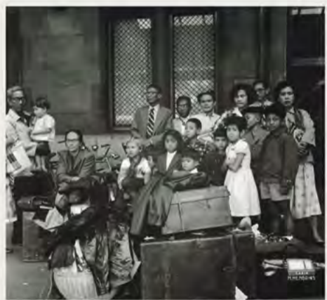
Foto van repatrianten voor het Centraal Station, 1955

ESAN wil het verhaal vertellen van de Indische Nederlanders die zich vanaf de jaren vijftig vestigden in Amsterdam Nieuw-West. Voor dat doel willen we 10 tot 15 ouderen interviewen over hun ervaringen. Wij willen daar graag een mooi boekje van maken.