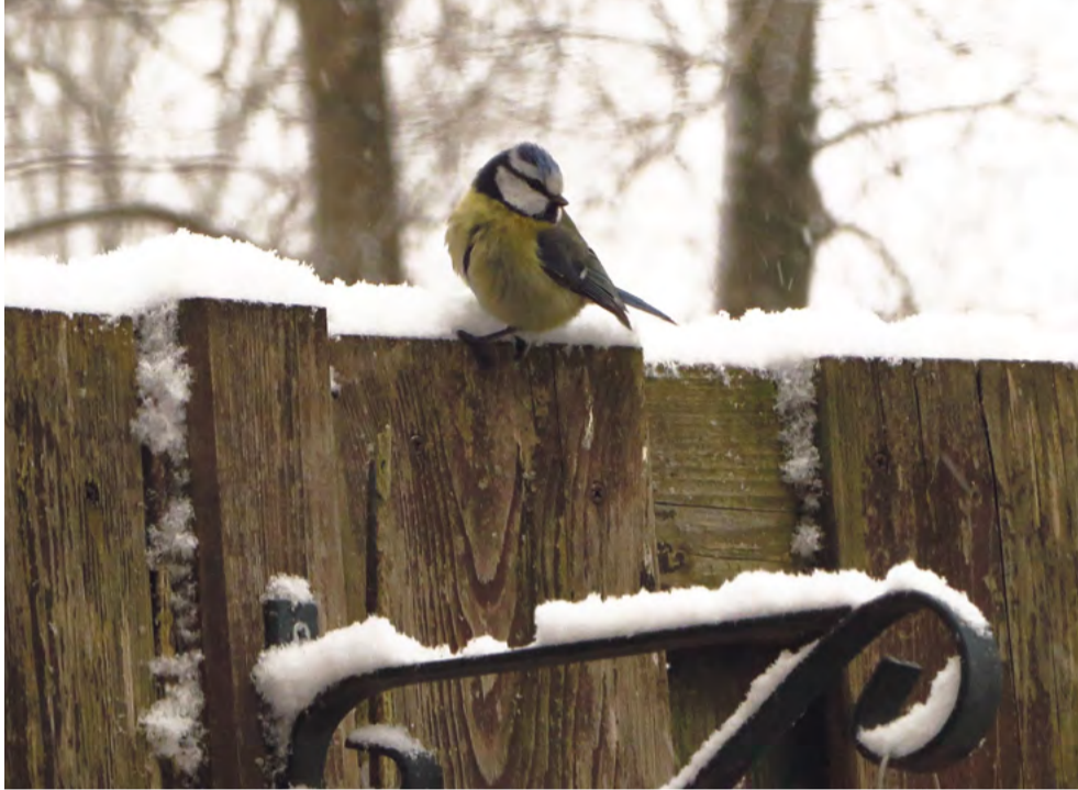
Pimpelmees in sneeuwtuin.

Elke winter moet het toch wel minstens één keer goed sneeuwen. Al was het alleen maar om de omgeving even met dat witte jasje aan te zien. En dan is het allemaal natuurlijk op z'n mooist als er nog niet over die onberispelijke dekking gelopen of gereden is. Alsof je in een sprookje beland bent.