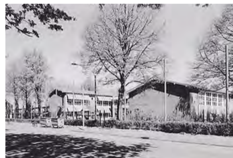
P.J. Troelstraschool, gezien vanaf de Savorin Lohmanstraat.