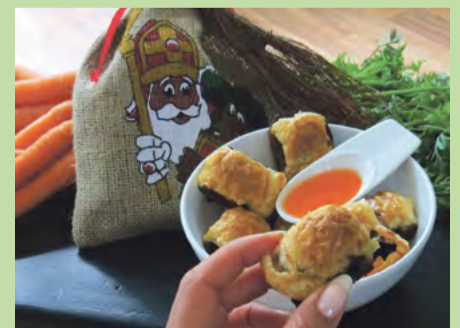
Smullen tijdens de feestdagen (de wortels op de achtergrond zijn voor het paard van Sinterklaas).

Voilà, je bent klaar! Serveer er zoete chilisaus bij en smikkelen maar!