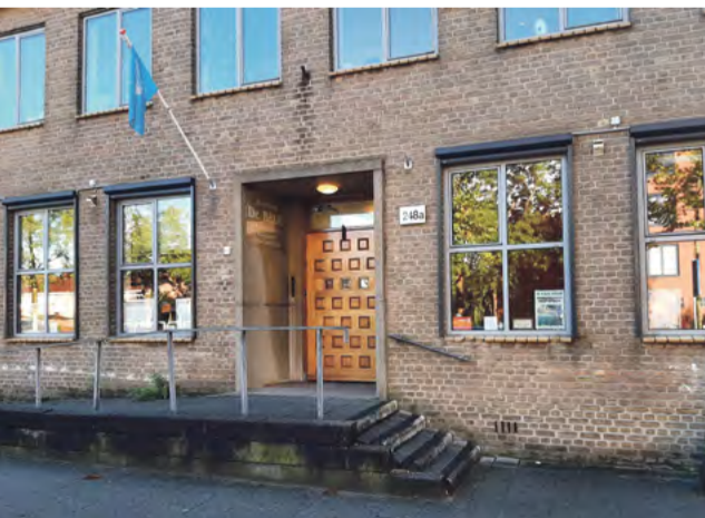
De Brug.

Op 22 november 2023 bestond de Brug precies 40 jaar. Het gebouw van de Brug begon in 1964 als het klooster van de Zusters van de Goddelijke Voorzienigheid en kreeg als naam het Mariaconvent. De zusters werkten in de buurt op scholen en in de thuiszorg. En zij hielpen bij de godsdienstuitoefening in de naast gelegen kerk van Onze-Lieve-Vrouw van de Zeven Smarten. Daar waren de Paters Kruisheren de priesters die voorgingen in de mis en de parochianen hielpen bij problemen. In de jaren '60 en '70 liep het aantal kerkbezoekers sterk terug en vonden ook de buurtbewoners die hulp nodig hadden, de weg naar de kerk en de hulp die daar geboden werd niet meer. Begin jaren '80 besloten de zusters en paters daarom dat zij het klooster zouden ombouwen tot de plek waar mensen de hulp en rust konden vinden die zij eerder in de kerk vonden. De zusters vonden hun plek op de bovenste etage van de pastorie en de Brug werd een Stichting en plek voor alle buurtbewoners voor hulp en gezelligheid. En nu 40 jaar later is dat nog altijd zo. De doelstelling 'helpen waar het nodig is en gezelligheid waar het kan' is 40 jaar onveranderd gebleven. De paters en zusters zijn eind vorige eeuw voorgoed vertrokken en de vrijwilligers hebben de taken overgenomen. Door de jaren heen doen gemiddeld 30 vrijwilligers alle taken in de Brug. En omdat de bevolkingssamenstelling in Nieuw-West sterk veranderd is, is de