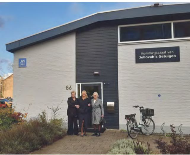
Koninkrijkszaal in de Bernard Loderstraat.

In de hal van deze oudste Koninkrijkszaal van Amsterdam, waar zo'n 60 personen samenkomen, liep ik meteen langs een wand met kleurrijke folders, zoals de Getuigen die graag overhandigen. Ik kreeg er onlangs een met de vraag 'Komt er ooit een eind aan pijn en verdriet?' De voorzitter, een ouder-