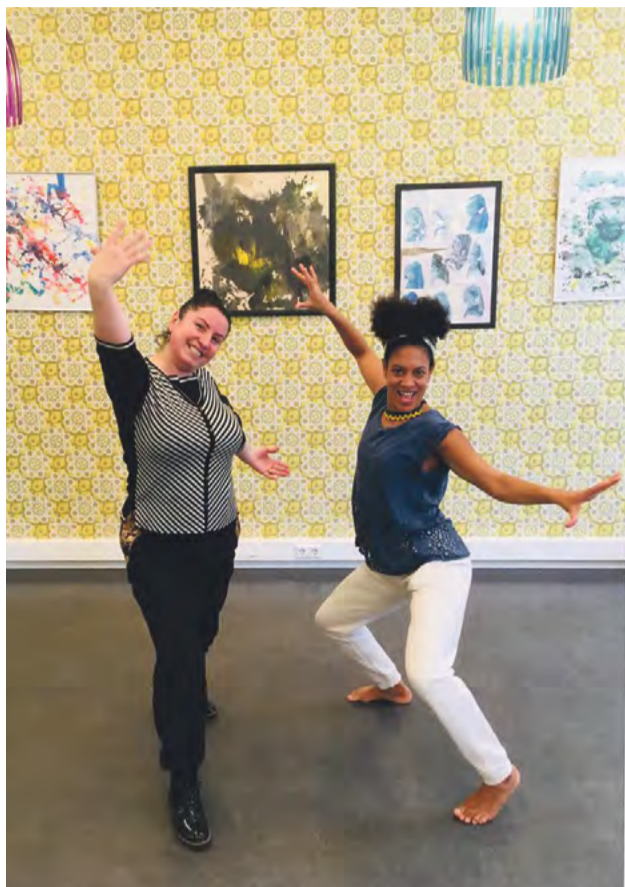
Dilruba en Avalon.

genieten van beweging, muziek en dans. In het dagelijks leven spreken zij verschillende talen, maar tijdens het dansen is het hun lichaamstaal en energie die ze met elkaar verbindt.