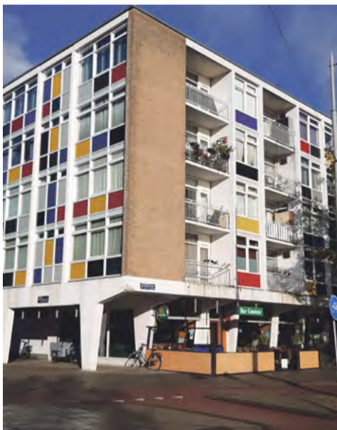
Bar Content in de 'verfdoos'.

Elke donderdag komt hier de Artiesten Reünie Club bijeen. De ARC bestaat al 75 jaar! De penningmeester verwijst me naar de website, You Tube en Instagram voor meer informatie. Oud-artiesten, zoals operazangeressen, goochelaars, cabaretiers en andere kunstenaars besloten in 1949 elkaar wekelijks te ontmoeten. Inmiddels zijn ook mensen die zijdelings met het vak te maken hebben, zoals decorbouwers bij de club betrokken. De geschenken die op een tafel klaar staan