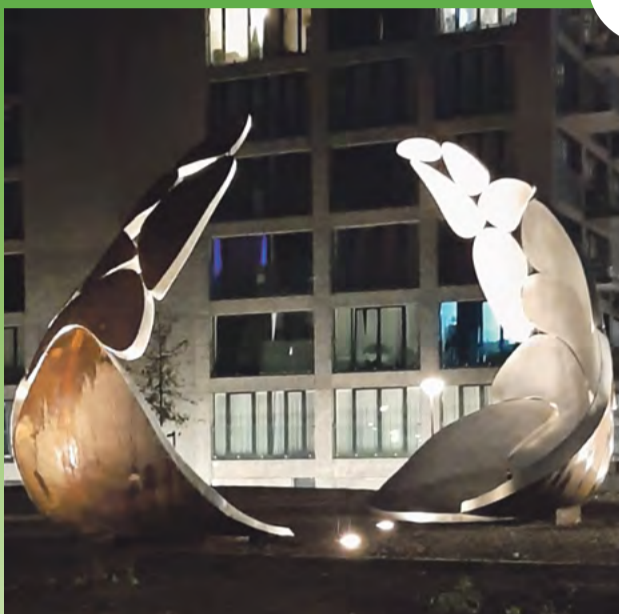
Kunstwerk RISE.

Daarmee staat het kunstwerk ook symbool, als een van de eerste monumenten die de Geuzen (waarnaar deze wijk genoemd is) de plek in de vaderlandse geschiedenis geeft, waar ze recht op hebben. Niet omdat het lieverdjes waren, integendeel. Oorlog en onderdrukking was toen, en is nu nog steeds, het ergste wat een mens kan overkomen. Maar zonder hen hadden wij hier niet zo broederlijk en zusterlijk naast elkaar kunnen leven. Rise is een veelomvattend woord en begrip, maar het is wel een Engels woord. Persoonlijk ben ik geen voorstander van het