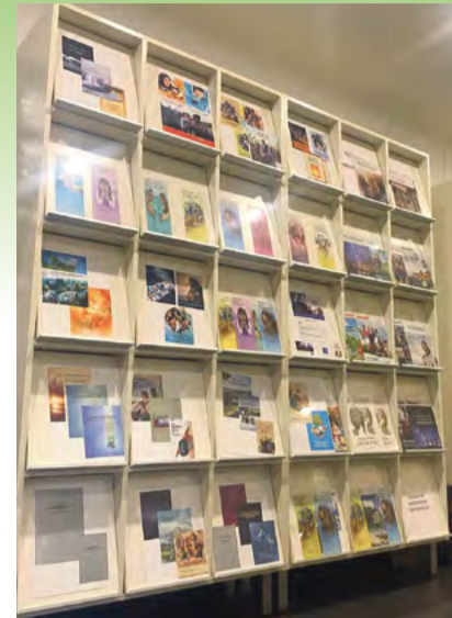
Wand met evangelisatiefolders.

Een video waarin een Getuige met depressieve klachten haar hart huilend uitstort bij Jehovah, wordt gevolgd door een 'vraag- en antwoordbespreking'. Wie wil reageren steekt de hand op. Daarna volgen praktische aanwijzingen voor een leven naar Gods wil: dat je vrienden vooral in de