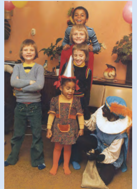
Mijn verjaardag in 1975.

We woonden op 1 hoog en je kon de buitendeur dan openen door bovenaan de trap aan een touwtje te trekken (een geweldige uitvinding). BOEM BOEM BOEM, klonk het op pakjesavond. Nu ben ik van nature al een snelle schrikker, maar die BOEM op pakjesavond was van een wel heel bijzonder kaliber. De verwachtingsvolle spanning die op zo'n moment door je heen kan gaan... ik scheet werkelijk zeven kleuren bagger. Nogmaals BOEM BOEM BOEM