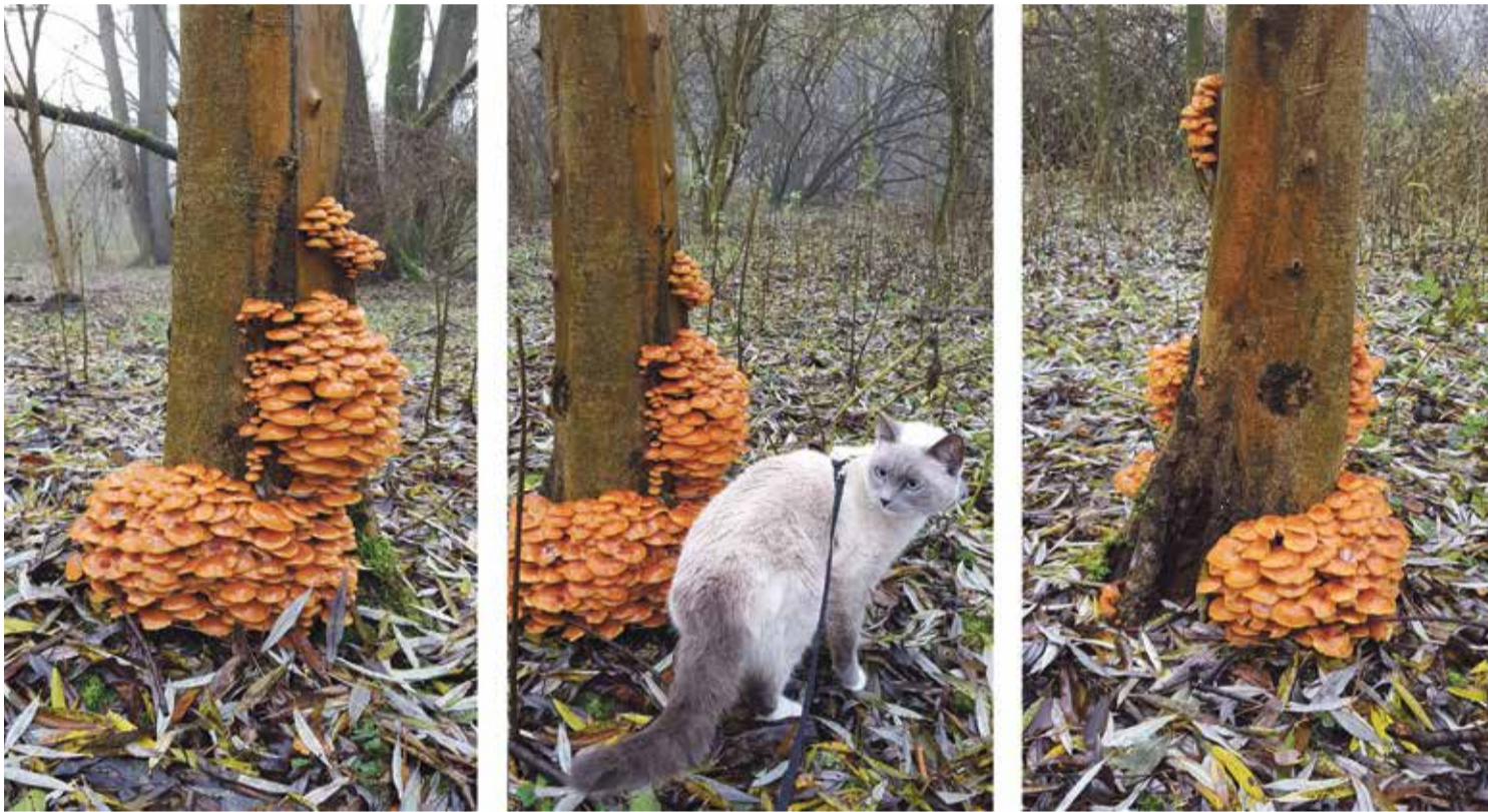
Avonturenpoes Disney met de fluweelpootjes.

Paddenstoelen, wat een wonderlijke verschijningen zijn dat. Toch weet ik er, net als velen met mij, maar weinig van. Dat kabouter Spillebeen ooit van dat ene exemplaar – rood met witte stippen – gevallen is, dat weten de meeste mensen wel. Dat het daarbij gaat om de vliegzwam, is alweer minder bekend. Gelukkig is het voor de natuurbeleving niet per se nodig om ergens de naam van te weten. Dat zijn maar labels. Het belangrijkste is dat je de verschijnselen opmerkt. Iets wat in de herfst niet zo moeilijk is. Al het moois wordt je dan letterlijk voor je voeten gesmeten en vroeg of laat raak je dan vanzelf wel in de ban van de paddenstoel ( als niet-gebruiker is dit overigens het enige 'paddo effect' waar ik zelf ervaring mee heb ).