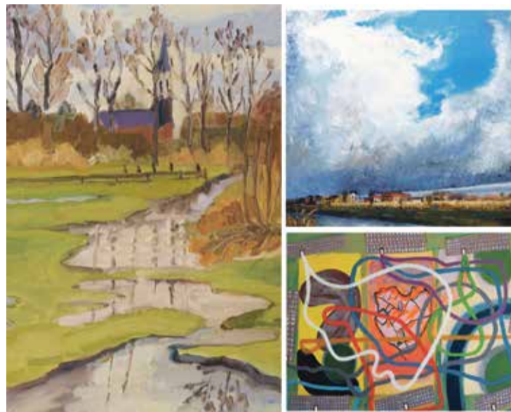
Impressie van de drie winnende doeken

Door de jury zijn 15 schilderijen genomineerd en uit die doeken heeft de jury drie winnaars gekozen. Op 2 september 2021 was de prijsuitreiking.