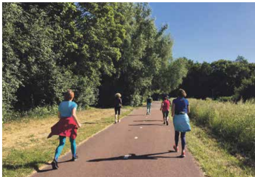
Powerwalk in het Sloterpark.

Powerwalken doe je buiten, bij voorkeur in een groene omgeving en zonder al te veel verkeer. Het Sloterpark, de Tuinen van West en De Bretten zijn bijvoorbeeld ideale