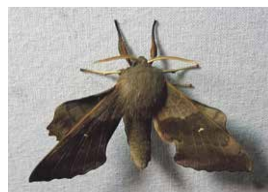
Grote belangstelling van jong en oud. Populierenpijlstaart.

Naast de volkstuinters komt ook altijd een heel aantal nachtvlinderwaarnemers af op het gebeuren, dat steeds wordt aangekondigd op de speciale app. De mensen maken er foto's van. Moest er tot voor kort in vlinderboeken gebladerd worden bij onbekende soorten, tegenwoordig kun je je ook lui laten helpen door de app ObsIdentify. Die weet bij de foto meestal de naam van de soort aan te geven.