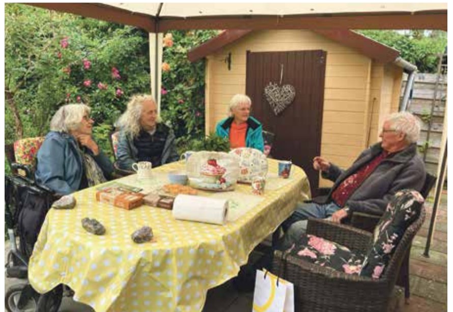
Ontmoeting bij een deelnemende volkstuint.

Prachtige paradijsjes waren er te zien, heel veel ook. Te veel om ze allemaal aan te doen. 's Morgens had ik een routekaart opgehaald bij de Pleinkamer op Lambertus Zijlplein 7. Ik had daar nog nooit van gehoord. Die is gevestigd in een leegstaande winkel, waar nu ook kleding geruild kan worden en waar achterin een expositieruimte is.