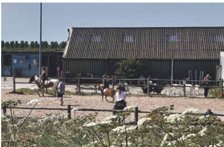
Manege gezien vanaf Lutkemeerweg.

Het blijkt hier heerlijk toeven. U bent altijd welkom om ook een kijkje te komen nemen. Heeft u een 'paardenmeisje', raadpleeg dan de website Hetmolenpaardje.net