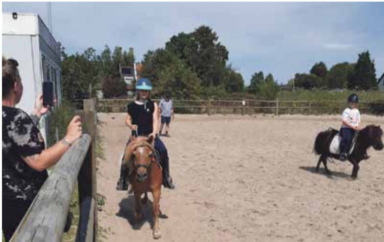
Trotse moeder filmt dochter.