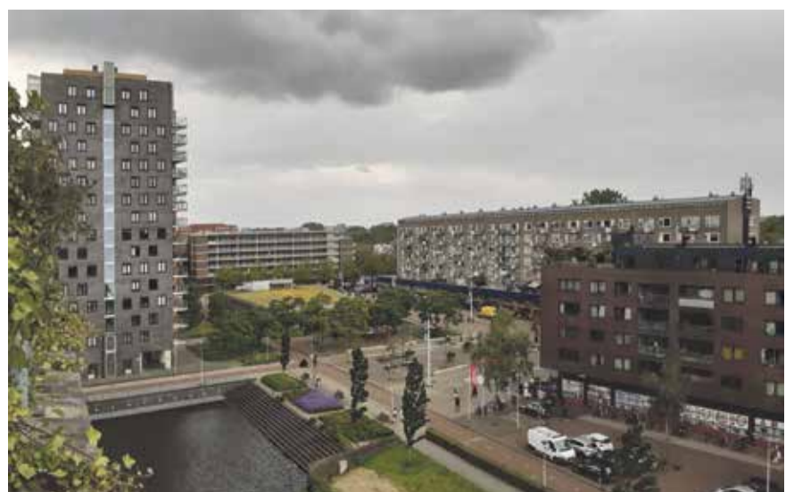
Lambertus Zijlplein gezien vanaf dakterras.

Graag had ik nog meer bezoeken afgelegd. In de Tuinen van West deden De Natuurtalent Tuin, Kwekerij Wiering, De Stadsgroenteboer/Jara, Mijn Stadstuin en de Fruittuin van West mee. Maar ook in Geuzenveld waren nog allerlei groene initiatieven te bewonderen. Die bezoek ik volgend jaar!