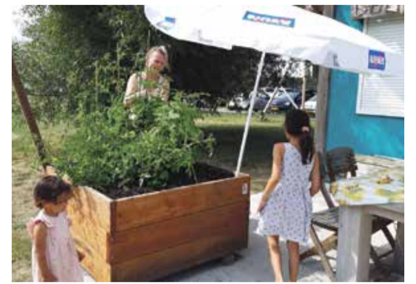
De eerste moestuin-activiteiten door bewoners rondom het Herman Hellingplantsoen.

Voor het opzetten van een activiteit kunt u een kijkje