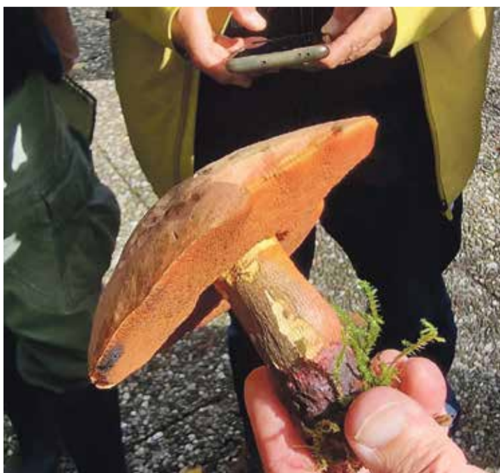
De heksenboleet (zie de magie met de QR-code).