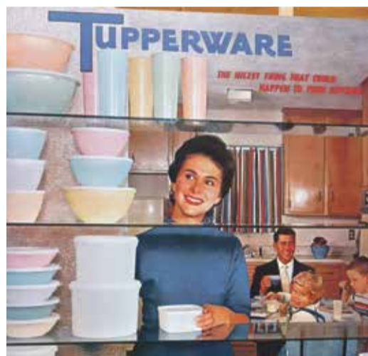
1950 – 1960 Tupperware.

Dat zie je terug in de productvorming: de Tupperware party's (1950-1960), waarmee vrouwen een